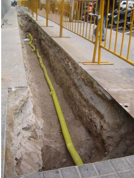
FOTO 1. Vista general del tram de la rasa situat entre el carrer Comerç i el Passeig Picasso.