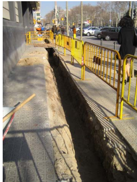
FOTO 4. Vista general del tram de la rasa situat entre els Passeigs Picasso i Lluís Companys.