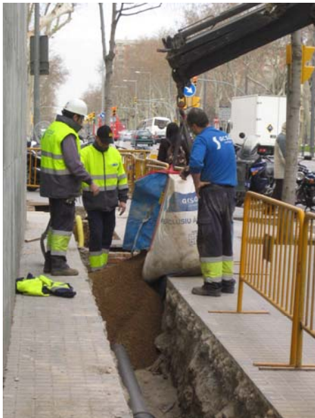
FOTO 3. Vista del procés de rebliment del tram de la rasa situat entre el carrer Comerç i el Passeig Picasso.