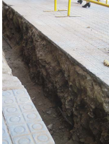
FOTO 2. Vista en detall del retall de la rasa.